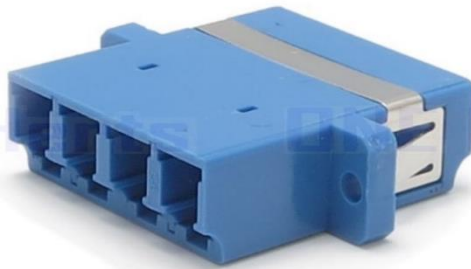
四聯LC耦合器 (雙母對接頭)