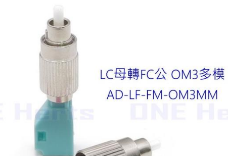
LC母轉FC公 OM3多模 AD-LF-FM-OM3MM