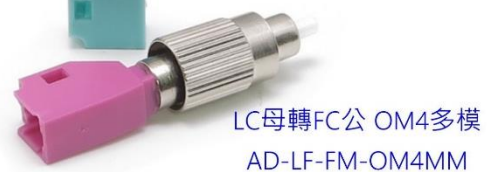
LC母轉FC公 OM4多模 AD-LF-FM-OM4MM